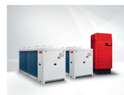
Hőszivattyús hibrid rendszer: Kb.500 kW fűtési teljesítménytől gyakran ajánlott a Hoval UltraGas® 2 álló gázkazán használata.

Az ilyen hibrid rendszerek esetén, ahol a TopGas® max kazán a teljes fűtési terhelés 50%-át teszi ki, a hőszivattyú biztosítja az éves energiafogyasztás 80%-os lefedését – mindezt megújuló energiával.