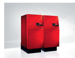
Kb. 500 kW teljesítménytől a Hoval UltraGas® álló gázkazán gyakran a gazdaságosabb megoldás.

Kb. 500 kW és az afeletti fűtőteljesítmény esetén azonban a nagyobb teljesítményű, Hoval UltraGas® 2 álló gázkazán használata ajánlott.